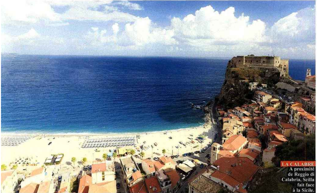
LA CALABRE A proximité de Reggio di Calabria, Scilla fait face à la Sicile.