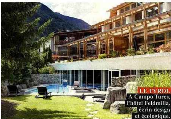
LE TYROL A Campo Tures, l'hôtel Feldmilla, écran design et écologique.