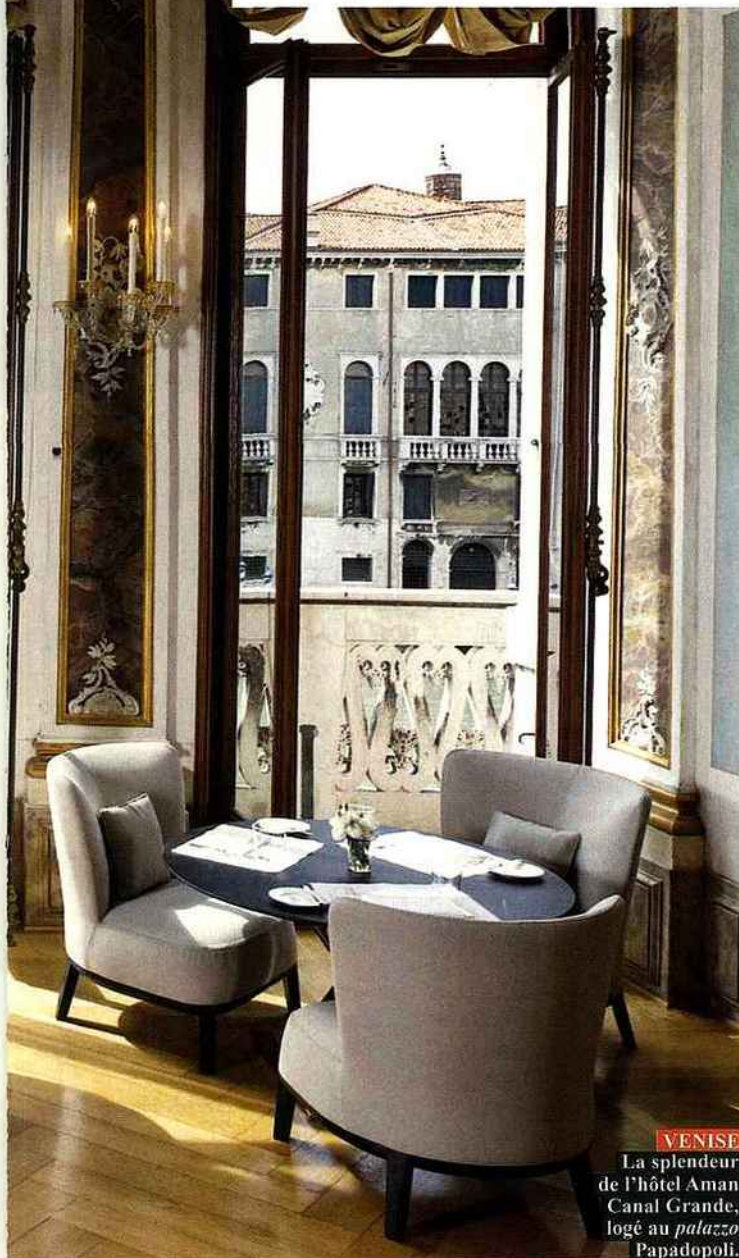
VENISE La splendeur de l'hôtel Aman Canal Grande, logé au palazzo Papadopoli.

Y aller : séjour de 3 jours/2 nuits pour deux personnes au départ de Paris, incluant les vols A/R sur Air France et le logement, sans les petits déjeuners, à partir de 2 194 €. www.amanresorts.com