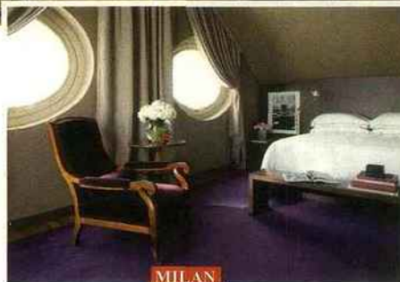
MILAN En haut, l'immense Duomo. Ci-dessus, l'élégance des chambres du Four Seasons.